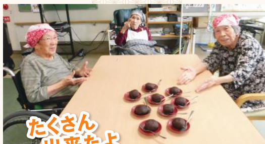
たくさん出来たよ

3階では、敬老者の表彰式と、9月の誕生者の紹介をしました。その後は、美味し〜い「おはぎ作り」をみんなで一緒に行いました。手であんこを延ばし、ご飯に包めば出来上がり！女性入所者の方は久しぶりの手作りの感触に感動されていました☺男性入所者は「うまか〜うまか」と舌鼓を打っておられました★皆さんに喜んでいただける敬老会ができてよかったです。