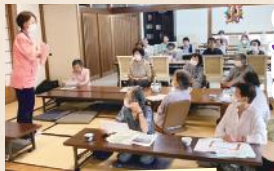
(9.22) JA女性部「ほほえみの会」様(大山地区)

出前講座の様子はホームページ・謙仁会Facebookで紹介しています。是非ご覧ください!!