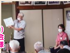
(9.11) 3区老人会「百歳会」様

5人程度の集まりでもぜひお伺いさせていただきますのでよかったですらお気軽にご相談ください!