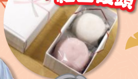
感謝の気持ち 紅白饅頭