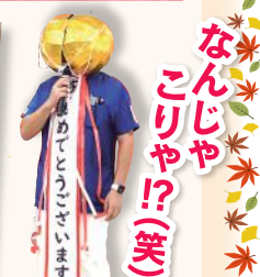
なんじゃこりや!? (笑)