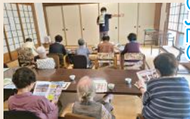
(9.13) JA女性部「ほほえみの会」様(曲川地区)