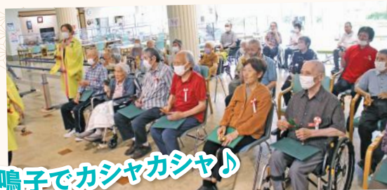
鳴子でカシャカシャ♪

ディケアでは、今年節目を迎えられる方に、お祝い状をお渡しし、お気持ちを一言ずついただきました。「幸寿園に来ることが楽しみです。いつもありがとうございます」などと、感謝の言葉をいただき、職員一同その言葉に嬉しくなりました。余興は感謝の気持ちを込めて“よさこい踊り”を披露しました。皆さんと一緒に盛り上がる事が出来て、とても充実した時間となりました。最後に、万歳三唱は敬老者の皆さんが元気で長生きできますよう、参加者全員で声高らかに万歳三唱をし、敬老会を締めくくりました。